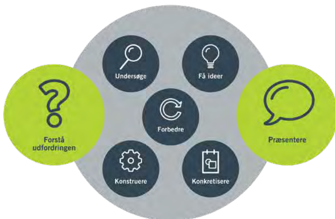
Figur 3.1: De syv delprocesser i engineering. To af processerne er fremhævet: Forstå udfordringen, da det er her, læreren sammen med klassen sætter projektet i gang. Præsentere, da det her, læreren og klassen afslutter projektet.

Engineering designprocessen er delt op i syv delprocesser (se figur 3.1).